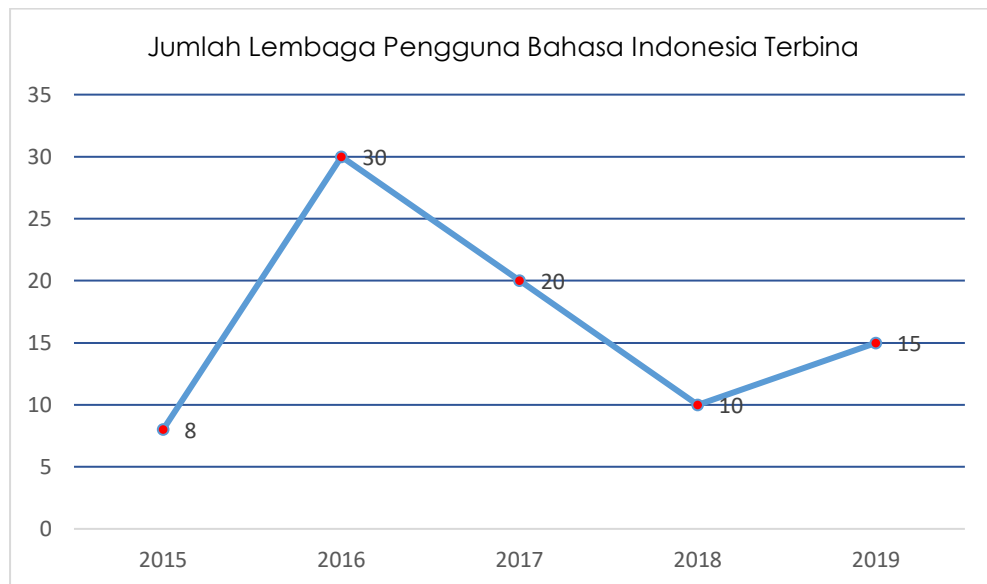
Garafik 1.1.3 Jumlah Lembaga Pengguna Bahasa Indonesia Terbina

Sasaran kegiatan ketiga, yaitu terwujudnya penggunaan bahasa Indonesia di ruang publik. Sasaran kegiatan terwujudnya penggunaan bahasa Indonesia di ruang publik dicapai melalui IKK jumlah lembaga pengguna bahasa Indonesia terbina. Capaian IKK jumlah lembaga pengguna bahasa Indonesia terbina mencapai 83 lembaga pemerintah dan swasta di seluruh Provinsi Lampung.