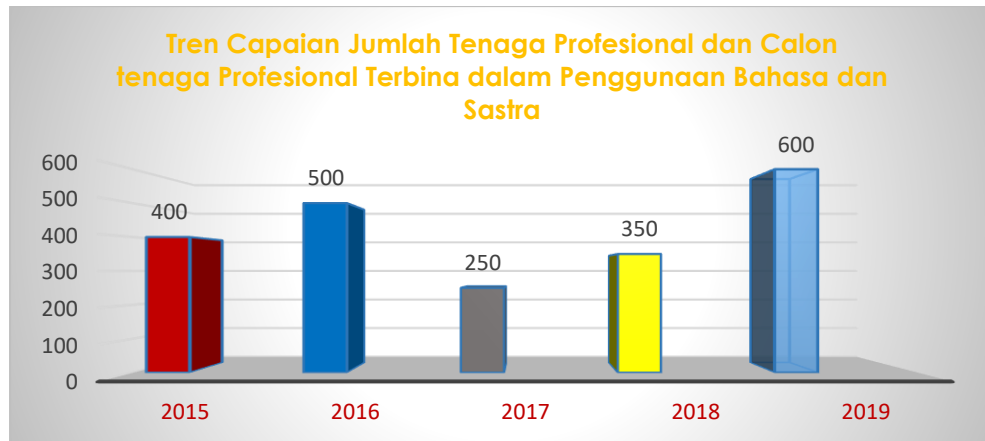
Garafik 1.1.4 Tren Capaian Jumlah Tenaga Profesional dan Calon tenaga Profesional Terbina dalam Penggunaan Bahasa dan Sastra

Sasaran kegiatan keempat, yaitu meningkatnya jumlah penutur bahasa terbina, dicapai melalui IKK jumlah tenaga profesional dan calon tenaga profesional terbina kemahiran berbahasa dan bersastra. Upaya peningkatan kemahiran berbahasa dan bersastra bagi tenaga profesional dan calon tenaga profesional melalui penyuluhan bahasa Indonesia hingga tahun 2019 mencapai 2100 orang.